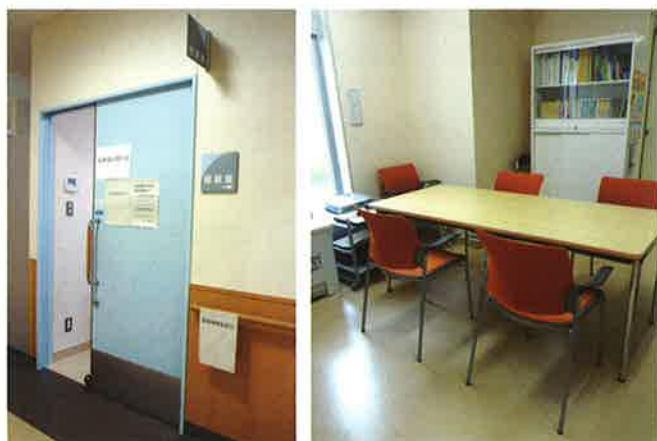
● 来院できない場合は、お電話でも相談を受け付けています