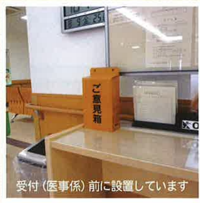
受付(医事係)前に設置しています

これまで多数の叱咤激励・ご意見・ご要望を頂き、厚くお礼申し上げます。頂いた「みなさまの声」の一件、一件を真摯に受け止め、改善につなげています。