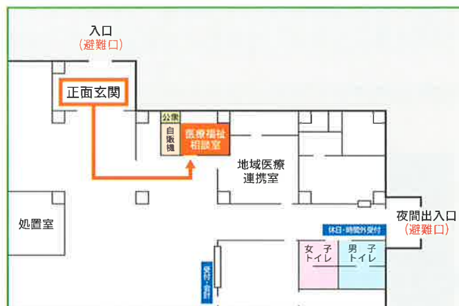
● 正面玄関左手に医療福祉相談室があります