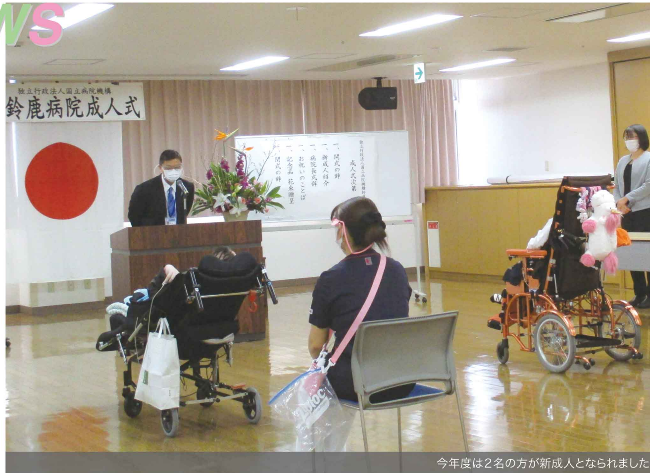
今年度は2名の方が新成人となりました