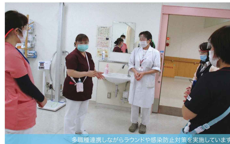
多職種連携しながらラウンドや感染防止対策を実施しています

ご家族様のお気持ちに配慮できるよう工夫をしています。新型コロナウイルス感染症対策により、患者様・ご家族様に御不便をおかけしていることに心苦しく思いますが、ご