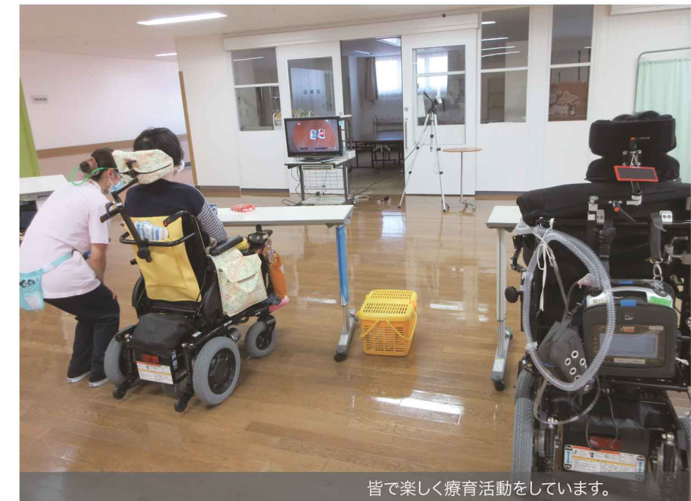
皆で楽しく療育活動をしています。

新型コロナウイルス流行中のため、療育活動は感染対策をしながら行っています。そんな中、筋ジストロフィー病棟では患者様同士が対面して接近し、手に触れるようなカードゲームをすることが難しくなりました。しかし、いい案を思いつきました！ビデオカメラで出されたカードをテレビモニターで大きく映すことで、接近・対面しなくてもカードゲームを楽しめるようになりました。今後も療育スタッフ一同十分な感染対策を行いながら、日々楽しめる療育活動ができるようにしていきたいと思っております。