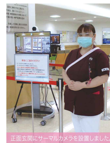
正面玄関にサーマルカメラを設置しました。

2020年は新型コロナウイルス感染症一色の一年でしたが、皆様にとって2020年はどのような一年でしたか？ 鈴鹿病院では「患者様が安心して療養」できるように、感染防止対策に日々取り組んでいます。標準予防策（マスク着用・ゴーグル着用・手指消毒・手洗い）の徹底、職員の健康観察、各設備の環境整備（医療機器・療養環境等の消毒）を確実にし、患者様にもマスク着用・手指衛生をお願いしております。面会はリモート面会を導入し、患者様・