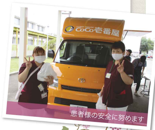
患者様の安全に努めます

また、匿名でご寄付を頂戴した事例も複数あり、厚くお礼申し上げます。頂戴しましたご支援につきましては、感染症対策をはじめ、当院の運営に活用させていただき、よりよい医療の提供に努めて行く所存です。よろしければ、引き続き皆様のお力添えをいただければ幸いです。