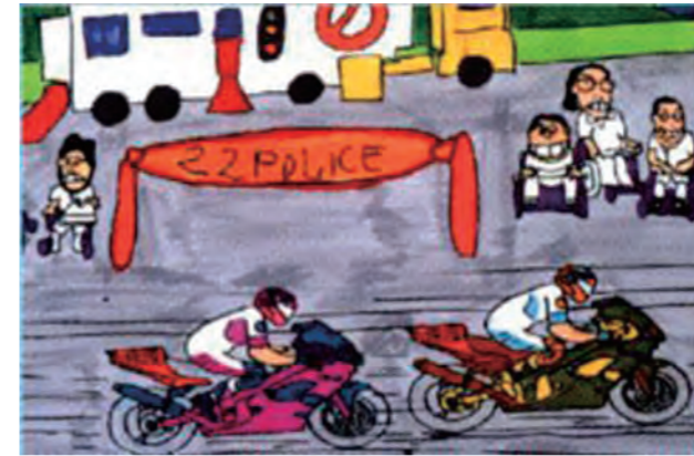
フランスの筋ジス患者の絵 (Team 22のパンフレット)

激突して亡くなってしまった。その後はシューマッハの時代が続いたが、引退翌年の2013年にスキー事故で頭部損傷し、今は障害者として療養生活を送っている。スピード王たちは命懸けなのだ。