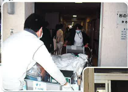
◀旧5病棟からの引越(人工呼吸器あり)。