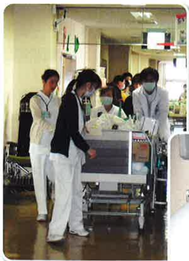
◀旧3病棟からの引越(点滴・酸素と人工呼吸器あり)。