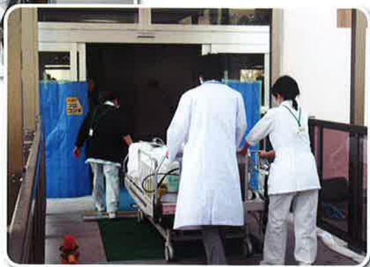
中央病棟入口(酸素と人工呼吸器あり)▶